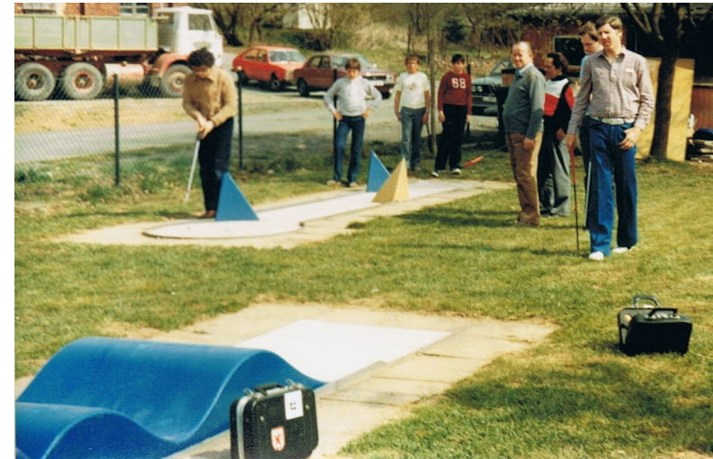
Minigolfanlage Biskirchen 1984